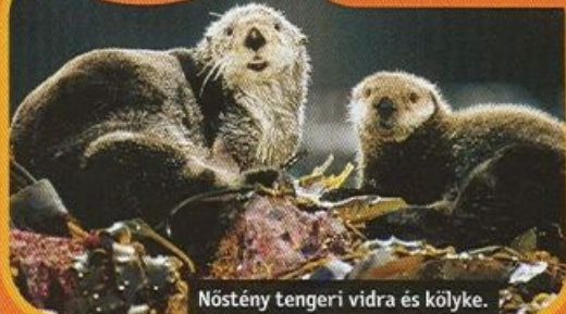
Nőstény tengeri vidra és kölyke.