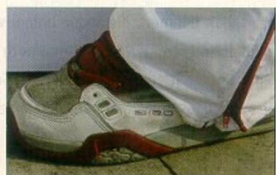
Bogi, 17 Jahre, Budapest, Studentin

Ihre BIZO fielen ihr bei einem Einkaufsbummel durch ein Shopping-Center ins Auge. Ein absolut bequemer Sportschuh, den sie seit August vergangenen Jahres nicht mehr missen möchte.