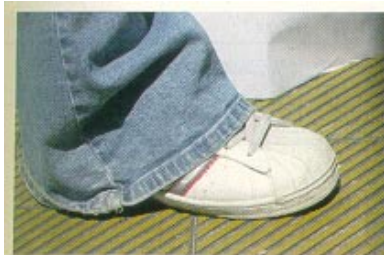
Kati, 22 Jahre, Budapest, Verkäuferin

Sie schwörte zumindest bis vor kurzem auf XIN-R-YUE Sportschuhe, die sie vor knapp einem Jahr am China-Markt nahe dem Orczy tér kaufte. Allerdings scheinen sich die Schuhe trotz regelmäßiger Pflege langsam aufzulösen, das Leder wird zunehmend poröser.