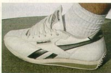
Attila, 22 Jahre, Budapest, Rezeptionsleiter

Vor rund einem Monat wählte seine Freundin die REEBOK-Schuhe für ihn aus. Eine wirkliche Pflege im großen Stil war bislang nicht notwendig, worunter der Tragekomfort keineswegs gelitten hat.