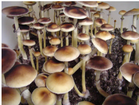
Pszilocibin gombák (Ecuador)