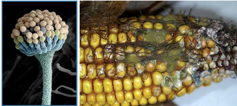
Penészedő kukorica ( Aspergillus flavus )

C) Három képet és három kifejezést, szócsoportot látsz. Párosítsd a szócsoportokat a hozzájuk tartozó képpel!