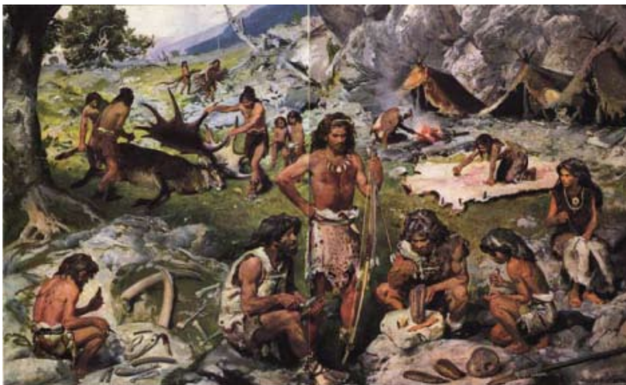
Josef Wolf - Zdeněk Burian: Az őskori ember . Gondolat, Bp., 1987. 106-107. oldal